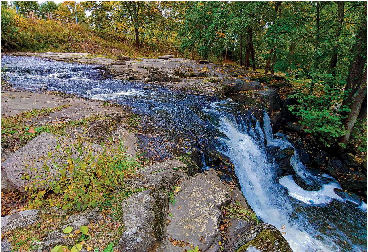
Strömbergin putouksen viereiseen kallioon louhitaan kaloille ja vesieläille kulkukelpoinen luonnomukainen kalatie.